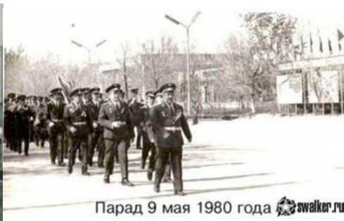
Парад 9 мая 1980 года