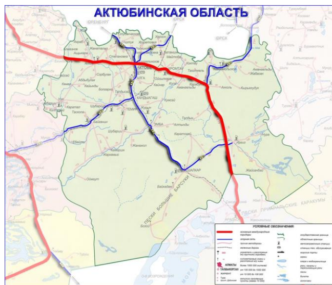
Шалқар ауданының картасы

Советтік дәуірге орыс тілі заңдары бойынша ассимиляциялау және сiңісу тән болатын. Осыдан қазақша Шалқар сөзінің орысша Челкар сөзіне фонетикалық өзгеру туындады. Ақтөбе облысының оңтүстігінде орналасқан аудан солтүстікте Үлкен және Кіші Борсық құмдарымен шектес. Біздің бабаларымыз бұл жерді «Қосшалқар» деп атаған, кейіннен ол қысқарып Шалқарға айналып кеткен. Шалқарға айналған бұл атау уақытында өзгеріске ұшырай қоймады. Алғашқы Қосшалқар ұғымы екі еселенген Шалқар түсінігін білдіреді. Мұндай мағына тек қана жер мен бедері ершеліктерін ғана беріп қоймай, көпшілік шырайымен ризықты жер мен байлық, молшылық ұғымын білдіреді (қос сөзі-бірігу, қосылу, сандық көбеюі ұғымында). Қазақстанның көптеген көлдеріне тән кең, шексіз мағынасына айналып кетті.